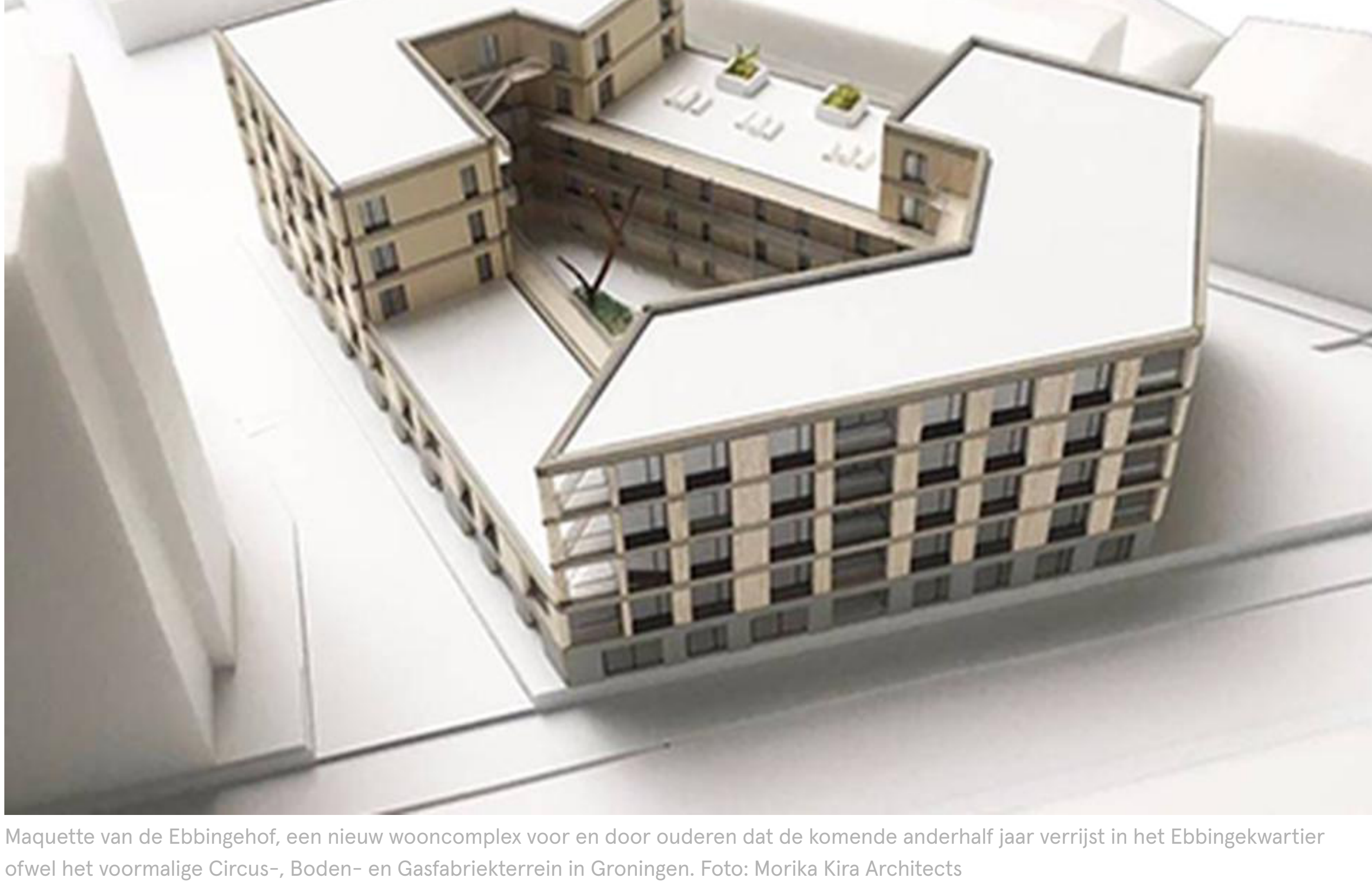
Maquette van de Ebbingehof, een nieuw wooncomplex voor en door ouderen dat de komende anderhalf jaar verrijst in het Ebbingekwartier ofwel het voormalige Circus-, Boden- en Gasfabriekterrein in Groningen. Foto: Morika Kira Architects

In het Ebbingekwartier in Groningen begint binnenkort de bouw van het Ebbingehof: veertig huurappartementen voor en door ouderen.